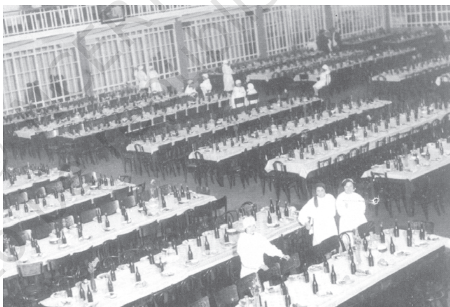
चित्र 17 - तीस के दशक में एक कारखाने का भोजन कक्ष.