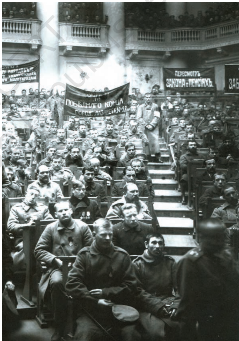
चित्र 8 - ड्यूमा में पेत्रोग्राद सोवियत की बैठक, फरवरी 1917.

बॉक्स 2 देखें और वर्तमान कैलेंडर के हिसाब से अंतर्राष्ट्रीय महिला दिवस की तिथि का पता लगाएँ।