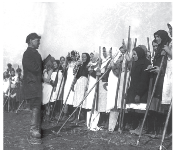
चित्र 19 - विशाल सामूहिक फ़ार्मों में काम करने के लिए जुटी किसान औरतें.

वी. सोकोलोव (सं.), ऑब्खाचेस्त्वो I व्लास्त, वी 1930-ये गोदी।