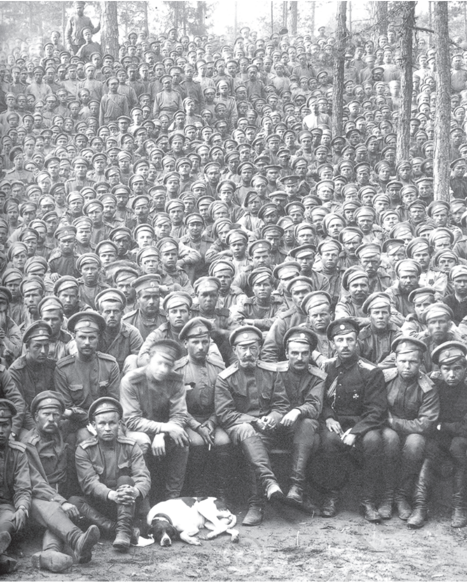
चित्र 7 - पहले विश्वयुद्ध के दौरान रूसी सिपाही . शाही रूसी सेना को 'रूसी स्टीमरोलर' कहा जाता था। यह दुनिया की सबसे बड़ी सशस्त्र सेना थी। जब इस सेना ने अपनी निष्ठा बदल कर क्रांतिकारियों को समर्थन देना शुरू कर दिया तो जार की सत्ता भी ढह गई।

युद्ध से उद्योगों पर भी बुरा असर पड़ा। रूस के अपने उद्योग तो वैसे भी बहुत कम थे, अब तो बाहर से मिलने वाली आपूर्ति भी बंद हो गई क्योंकि बाल्टिक समुद्र में जिस रास्ते से विदेशी औद्योगिक सामान आते थे उस पर जर्मनी का कब्जा हो चुका था। यूरोप के बाकी देशों के मुकाबले रूस के औद्योगिक उपकरण ज़्यादा तेजी से बेकार होने लगे। 1916 तक रेलवे लाइनें टूटने लगीं। अच्छी सेहत वाले मर्दों को युद्ध में झोंक दिया गया। देश भर में मज़दूरों की कमी पड़ने लगी और ज़रूरी सामान बनाने वाली छोटी-छोटी वर्कशॉप्स ठप्प होने लगीं। ज़्यादातर अनाज सैनिकों का पेट भरने के लिए मोर्चे पर भेजा जाने लगा। शहरों में रहने वालों के लिए रोटी और आटे की किल्लत पैदा हो गई। 1916 की सर्दियों में रोटी की दुकानों पर अकसर दंगे होने लगे।