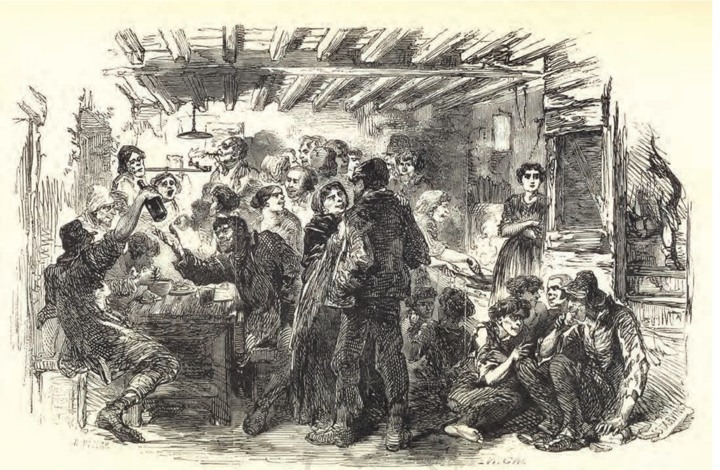
चित्र 1 - उन्नीसवीं शताब्दी के मध्य में लंदन के गरीबों की दशा उसी समय के एक व्यक्ति की दृष्टि से.

स्रोत : हेनरी मेह्यू, लंदन लेबर ऐन्ड लंदन पुअर, 1861