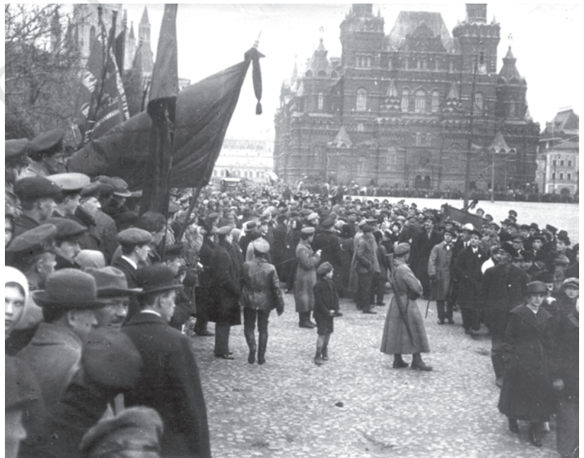
चित्र 13 - मास्को में मई दिवस का प्रदर्शन, 1918.