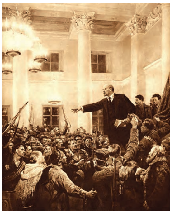
चित्र 9 - अप्रैल 1917 में मज़दूरों को संबोधित करते लेनिन की एक बोल्शेविक छवि .

गांवों में किसान और उनके समाजवादी क्रांतिकारी नेता भूमि पुनर्वितरण के लिए दबाव डालने लगे थे। इस काम के लिए भूमि समितियाँ बना दी गई थीं। सामाजिक क्रांतिकारियों से प्रेरणा और प्रोत्साहन लेते हुए जुलाई से सितंबर के बीच किसानों ने बहुत सारी ज़मीन पर कब्ज़ा कर लिया।