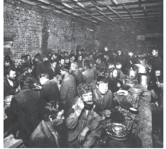
चित्र 5 - युद्ध से पहले सेंट पीटर्सबर्ग में बेरोजगार किसान. बहुत सारे लोग धर्मार्थ लंगरों में खाना खाते थे और खस्ताहाल मकानों में रहते थे।

सामाजिक स्तर पर मजदूर बँटे हुए थे। कुछ मजदूर अपने मूल गाँवों के साथ अभी भी गहरे संबंध बनाए हुए थे। बहुत सारे मजदूर स्थायी रूप से शहरों में ही बस चुके थे। उनके बीच योग्यता और दक्षता के स्तर पर भी काफी फ़र्क था। सेंट पीटर्सबर्ग के एक धातु मजदूर ने कहा था : 'धातुकर्मी मजदूरों में खुद को साहब मानते थे। उनके काम में ज्यादा प्रशिक्षण और निपुणता की जरूरत जो रहती थी...।' 1914 में फैक्ट्री मजदूरों में औरतों की संख्या 31 प्रतिशत थी लेकिन उन्हें पुरुष मजदूरों के मुकाबले कम वेतन मिलता था (मर्दों की तनखाह के मुकाबले आधे से तीन-चौथाई तक)। मजदूरों के बीच मौजूद फ़ासला उनके पहनावे और व्यवहार में भी साफ़ दिखाई देता था। यद्यपि कुछ मजदूरों ने बेरोजगारी या आर्थिक संकट के समय एक-दूसरे की मदद करने के लिए संगठन बना लिए थे लेकिन ऐसे संगठन बहुत कम थे।