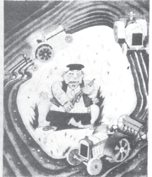
चित्र 18 - सामूहिकीकरण के दौर का एक पोस्टर.

इसमें लिखा है: 'हम खेती में कमी लाने वाले कुलक पर वार करेंगे!'