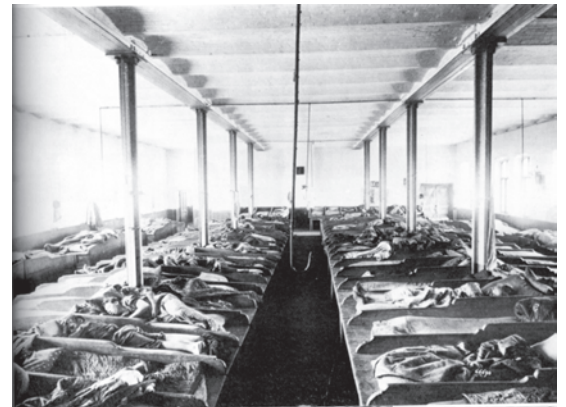
चित्र 6 - क्रांति-पूर्व रूस में एक डॉर्मिटरी में बने बंकर में सोते मजदूर. वे पालियों में बारी-बारी से सोते थे और परिवार को साथ नहीं रख सकते थे।