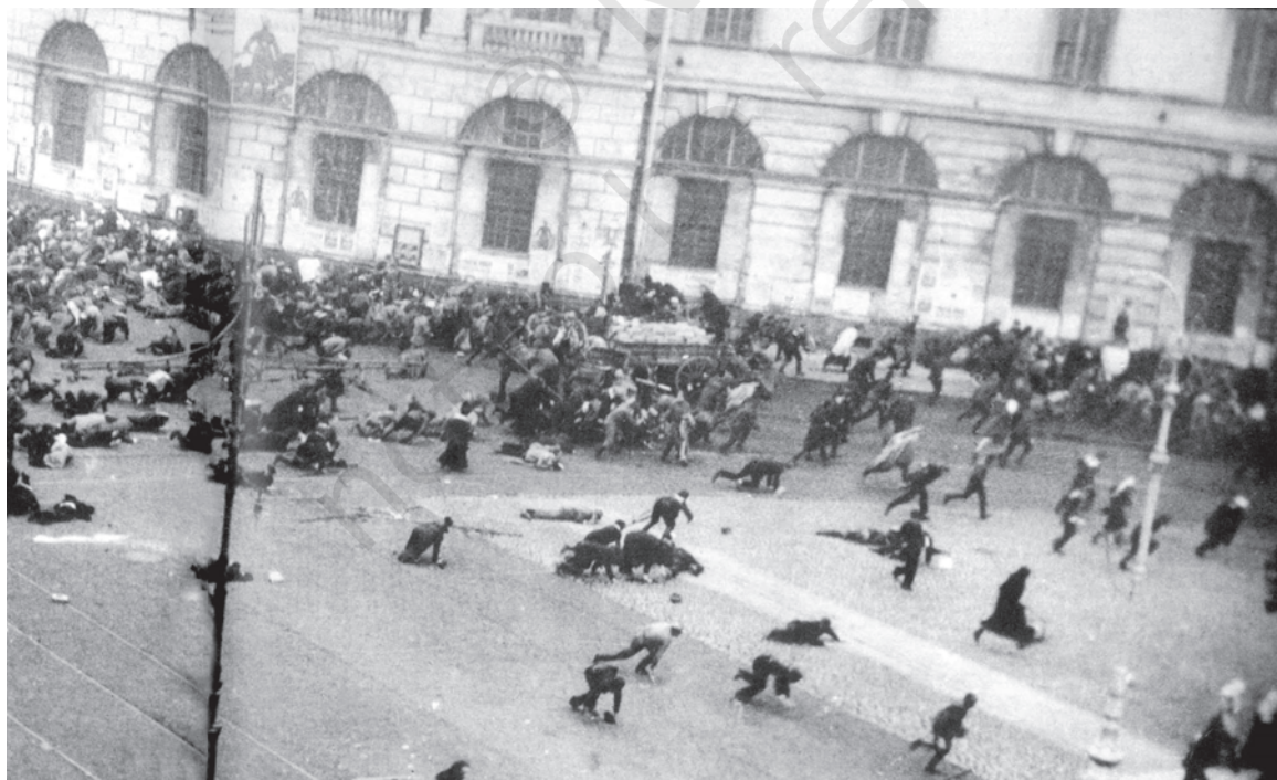
चित्र 10 - जुलाई के दिन .

17 जुलाई 1917 को बोल्शेविक समर्थक प्रदर्शनकारियों पर सेना द्वारा गोलीबारी का दृश्य।