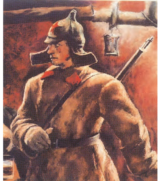
चित्र 12 - सोवियत टोपी (बुदियोनोव्का) पहने एक सिपाही.

बोलशेविक पार्टी का नाम बदल कर रूसी कम्युनिस्ट पार्टी (बोलशेविक) रख दिया गया। नवंबर 1917 में बोलशेविकों ने संविधान सभा के लिए चुनाव कराए लेकिन इन चुनावों में उन्हें बहुमत नहीं मिल पाया। जनवरी 1918 में असेंबली ने बोलशेविकों के प्रस्तावों को खारिज कर दिया और लेनिन ने असेंबली बर्खास्त कर दी। उनका मत था कि अनिश्चित परिस्थितियों में चुनी गई असेंबली के मुकाबले अखिल रूसी सोवियत कांग्रेस कहीं ज़्यादा लोकतांत्रिक संस्था है। मार्च 1918 में अन्य राजनीतिक सहयोगियों की असहमति के बावजूद बोलशेविकों ने ब्रेस्ट लिटोव्स्क में जर्मनी से संधि कर ली। आने वाले सालों में बोलशेविक पार्टी अखिल रूसी सोवियत कांग्रेस के लिए होने वाले चुनावों में हिस्सा लेने वाली एकमात्र पार्टी रह गई। अखिल रूसी सोवियत कांग्रेस को अब देश की संसद का दर्जा दे दिया गया था। रूस एक-दलीय राजनीतिक व्यवस्था वाला देश बन गया। ट्रेड यूनियनों पर पार्टी का नियंत्रण रहता था। गुप्तचर पुलिस (जिसे पहले चेका और बाद में ओजीपीयू तथा एनकेवीडी का नाम दिया गया) बोलशेविकों की आलोचना करने वालों को दंडित करती थी। बहुत सारे युवा लेखक और कलाकार भी पार्टी की तरफ़ आकर्षित हुए क्योंकि वह समाजवाद और परिवर्तन के प्रति समर्पित थी। अक्टूबर 1917 के बाद ऐसे कलाकारों और लेखकों ने कला और वास्तुशिल्प के क्षेत्र में नए प्रयोग शुरू किए। लेकिन पार्टी द्वारा थोपी गई सेंसरशिप के कारण बहुत सारे लोगों का पार्टी से मोह भंग भी होने लगा था।